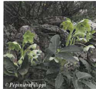
Hellebore de Corse Helleborus argutifolius Hauteur : 60 cm Sol : Léger, bien drainé Floraison : Janvier à mars