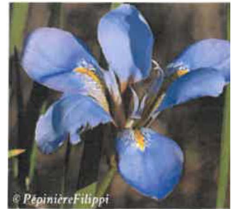
Iris d'Alger Iris unguicularis Hauteur : 30 cm Sol : Léger, bien drainé Floraison : Décembre à mars