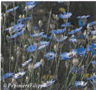
Catananche Catananche caerulea Hauteur : 10 à 50 cm Sol : Bien drainé Floraison : Juin à juillet