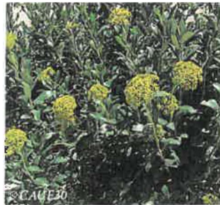
Buplèvre ligneux Bupleurum fruticosum Hauteur: 1 à 2 m Sol : Terre de bruyère Floraison : Eté