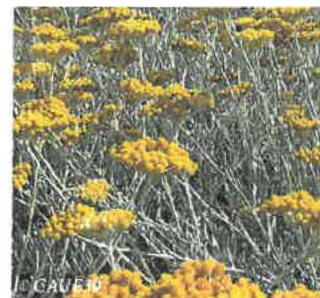
Cinéraire maritime Cineraria maritima

Hauteur : 50 à 60 cm Sol : Ordinaire Floraison : Mai à juillet