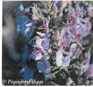
Romarin Rosmarinus officinalis Hauteur : 1 à 1,5 m Sol : Ordinaire Floraison :