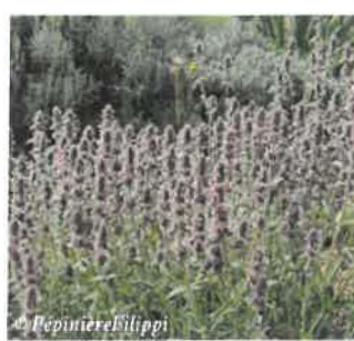
Stachys Stachys cretica Hauteur: 15 à 50 cm Sol : Caillouteux, drainé Floraison : Juin