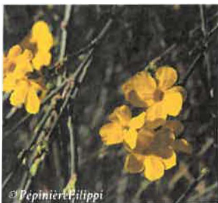
Jasmin jaune Jasminum nudiflorum Hauteur : 1 à 2 m Sol : Ordinaire Floraison : Janvier à mars