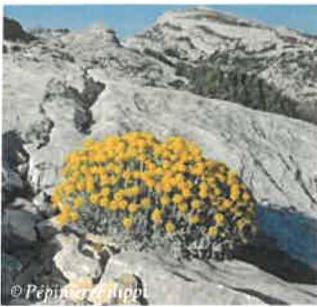
Santoline faux cyprès Santolina chamaecyparissus Hauteur : 50/60 cm Sol : Ordinaire Floraison : Juin à août