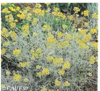
Immortelle commune Helichrysum stoechas

Hauteur : 50 cm Sol : Ordinaire Floraison : Juin à octobre