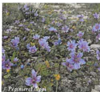
Mauve sylvestre Malva sylvestris

Hauteur : 20 à 50 cm Sol : Ordinaire Floraison : Mai à septembre