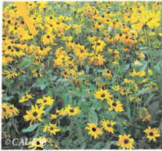
Rudbeckie Rudbeckia fulgida Hauteur : 1 m Sol : Ordinaire, bien drainé Floraison : Juin à septembre