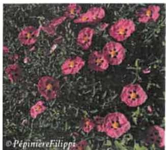
Ciste Cistus x purpureus

Hauteur : 1m Sol : Plutôt pauvre Floraison : Printemps