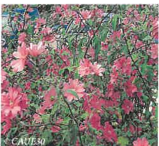
Lavatère maritime Lavatera maritima

Hauteur : 50 à 140 cm Sol : Ordinaire Floraison : Juillet à octobre