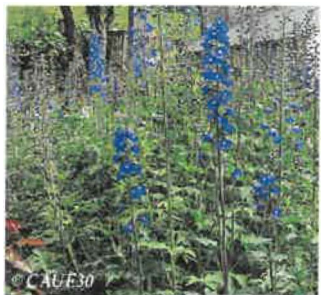
Pied d'alouette Delphinium elatum

Hauteur : 1m (en fleurs) Sol : Floraison : Fin d'été