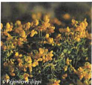
Coronille glauque Coronille valentina

Hauteur : 80 cm Sol : Pauvre, bi Floraison : Mars à mai