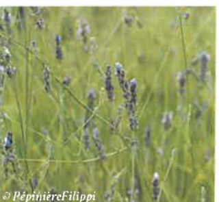
Lavande à grandes feuilles Lavandula latifolia

Hauteur : 20 à 80 cm Sol : Ordinaire, bien drainé Floraison : Eté