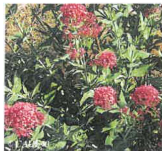
Valériane rouge Centranthus ruber

Hauteur : 60 à 100 cm Sol : Ordinaire, voire pauvre Floraison : Mai à septembre