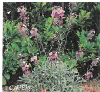
Giroflée vivace Erysimum 'Bowles Mauve'

Hauteur : 60 cm Sol : Drainé Floraison : Printemps