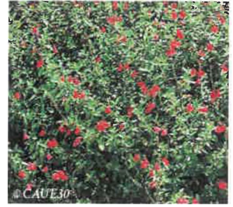
Sauge arbustive Salvia microphylla Hauteur : 60 à 100 cm Sol : Léger, bien drainé Floraison : Avril à octobre