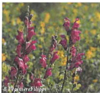
Gueule de loup Antirrhinum majus

Hauteur : 15 à 120 cm Sol : Plutôt riche, drainé Floraison : Juin à septembre