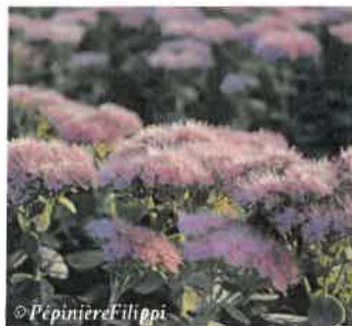
Orpin des jardins Sedum spectabile Hauteur : 20 à 50 cm Sol : Ordinaire Floraison : Août à octobre