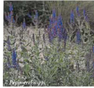
Sauge Salvia amplexicaule Hauteur : 20 à 60 cm Sol : Léger, bien drainé Floraison : mai à juillet