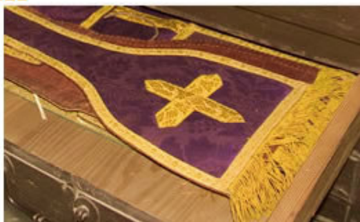
à droite : détail de vêtement liturgique (étole)