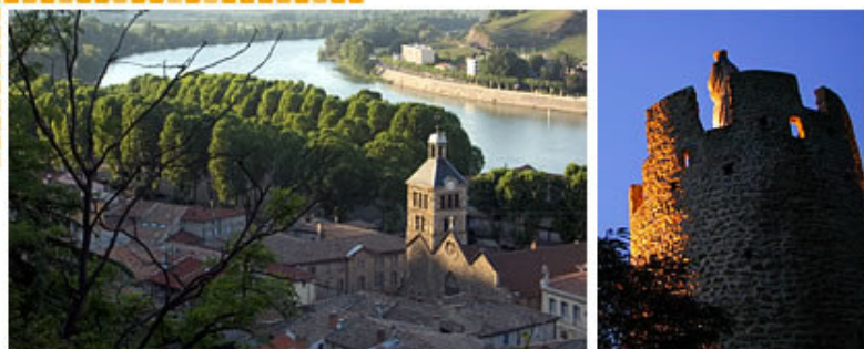
Vue panoramique depuis le sentier des tours - Tour de l'hôpital

Aujourd'hui il n'en subsiste que trois, dont l'une est en partie démolie. La tour de l'Hôpital, inscrite sur l'inventaire des Monuments historiques, daterait du XVIème siècle. Au XIXème siècle, une Vierge fut installée à son sommet en l'honneur de Notre Dame de Montaigu.