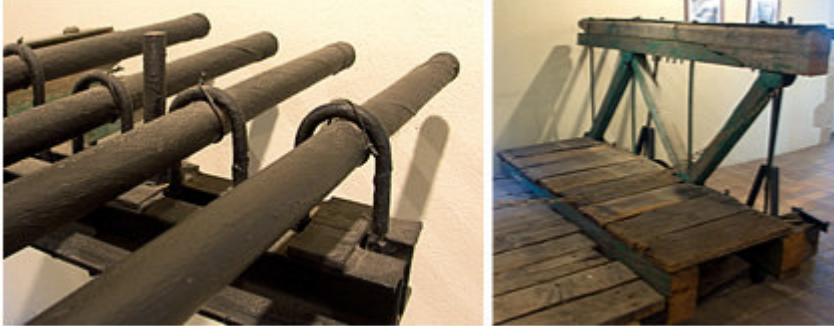
Détails du premier pont de Tournon-sur-Rhône visibles au Château-Musée

Réalisé en un temps record par Marc Seguin et ses frères, en 18 mois à peine, le premier pont suspendu entre Tournon et Tain, achevé en 1825, fut le premier grand pont suspendu en Europe continentale à utiliser des câbles de fil de fer et non des chaînes en fer forgé comme il était d'usage. Plus économiques, plus résistants, plus flexibles et moins complexes à fabriquer, les câbles de fils de fer offraient tous les avantages. Après avoir connu un vif succès, ce premier pont devint rapidement inadapté à l'augmentation du trafic routier et aux passages fréquents des bateaux à vapeur. Transformé par la suite en passerelle pour piétons, il fut finalement détruit en 1965, non sans protestations. Une plaque sur le Quai Marc Seguin signale son emplacement.