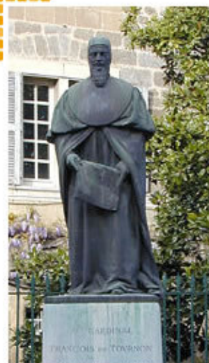
Le Cardinal François de Tournon