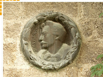
Médaille représentant Stéphane Mallarmé Sculpture de Marcel Gimond (1948)

Riche de nombreuses sculptures, Tournon s'illustre tout particulièrement dans l'art sculpté des années 30 : Marcel Gimond (Tournon, 1894 - Nogent-sur-Marne, 1961) et Antoine Sartorio (Menton, 1885 - Jouques, 1988) ont agrémenté la ville de leurs oeuvres.