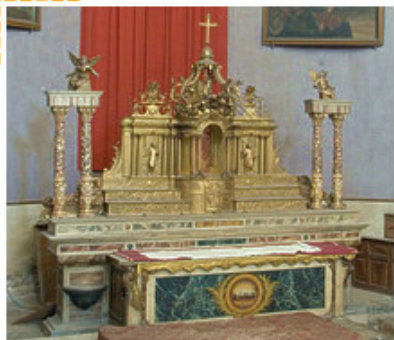
Autel de style baroque du XVIIème-XVIIIème siècle

Plus tardive mais non moins intéressante, la chapelle du lycée de Tournon est tout à fait jésuite d'esprit : sa façade à volutes renversées, ses ordres superposés, ses tribunes latérales en attestent.