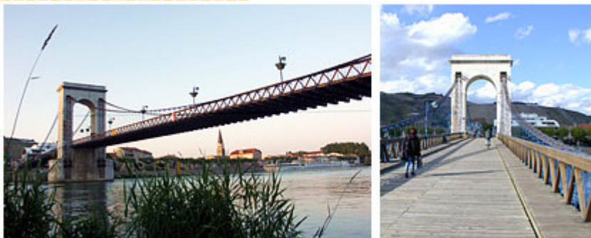
La passerelle pour piétons qui relie Tournon-sur-Rhône et Tain L'Hermitage

Un deuxième pont, sur le même modèle mais plus élevé et à double voie, fut donc construit par les frères Seguin, entre 1847 et 1849, cent mètres en aval du premier. L'ensemble de la suspension a la forme d'un « berceau », légèrement cintré au milieu, donnant ainsi davantage de rigidité à l'ensemble de la travée. C'est aujourd'hui une passerelle pour piétons.