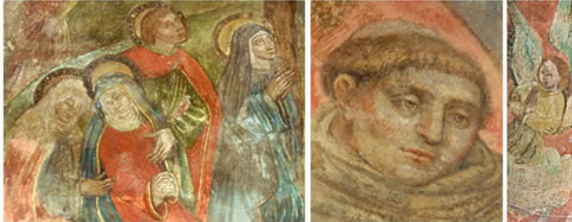
chapelle des pénitents : détails

La chapelle latérale des Pénitents est la partie la plus ancienne de l'église. Elle abrite un magnifique ensemble de peintures murales du XV e -XVI e siècle qui illustrent notamment la Passion du Christ. La variété des couleurs et la maîtrise de composition font de cet ensemble une réalisation de qualité.