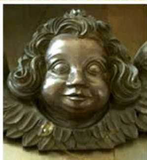
à gauche : détail de la chaire

Commencée seulement en 1673 et terminée en 1714, elle n'a probablement pas été construite, selon Pierre Moisy, selon les plans d'Etienne Martellange (1568 ou 1569-1641), architecte renommé à l'origine de nombreuses églises jésuites. Epargnée par l'incendie de 1714, elle reçut un temps la dépouille du cardinal de Tournon, mort à St-Germain-en-Laye en 1562.