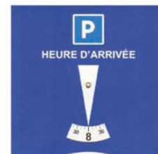
Disque européen conforme (art R4 17.3 code de la route)

Pour faire sa demande, il suffit de télécharger le formulaire sur www.ville-tournon.com et de déposer le dossier complet (formulaire + chèque) au service des places ou à l'accueil de la mairie.